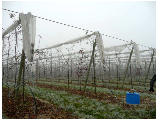
Une initiative du CCAE AGROPOMME en collaboration avec le Réseau Agriconseils des Laurentides et le bureau régional du MAPAQ des Laurentides.