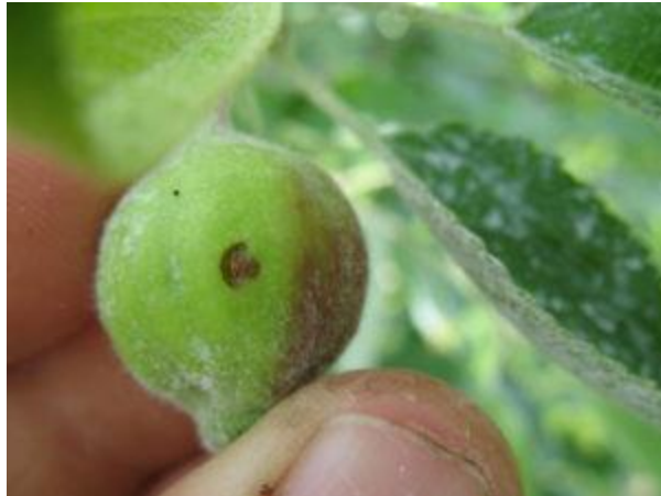
Dommmage de ponte du charançon de la prune en forme de croissant de lune

Ce dommmage apparaît lorsque la femelle insère son œuf sous la pelure de la pomme et qu'elle mange ensuite la pelure autour de l'œuf. Cette opération forme une cicatrice caractéristique en forme de croissant de lune, qui permet à l'œuf de ne pas être écrasé lorsque le fruit grossit.