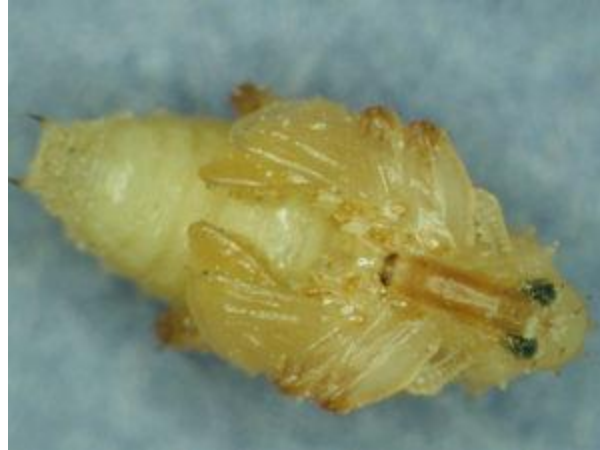
Nymphe du charançon de la prune

Au début du mois d'août, les nouveaux adultes commencent à émerger et à se nourrir de pommes. Ces adultes sont toutefois incapables de se reproduire et de pondre des œufs avant d'avoir complété leur développement, pendant l'hiver. Il n'y a donc qu'une seule génération par année.