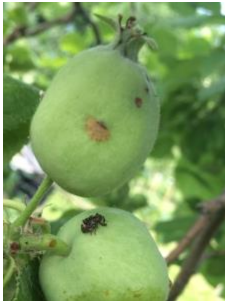
Dommmage de ponte du charançon de la prune cicatrisé