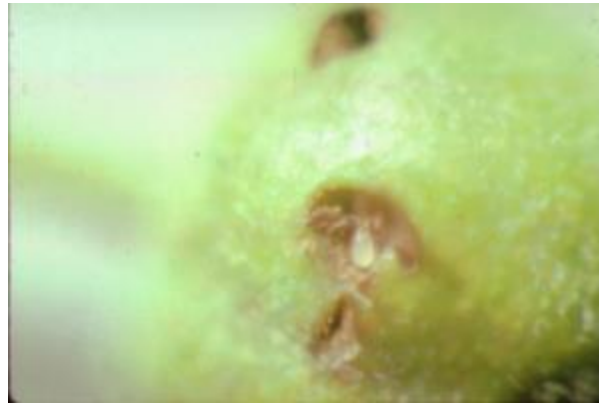
Œuf de charançon de la prune (la pelure a été abaissée afin de le rendre visible)

À la faveur de journées chaudes et calmes du printemps, les charançons se déplacent vers le verger. L'accouplement débute habituellement durant la floraison, et la ponte dès la nouaison des fruits. Une seule femelle peut pondre jusqu'à 200 œufs en quelques semaines. Les œufs sont pondus individuellement sous la pelure des jeunes fruits et l'éclosion survient de 3 à 12 jours après la ponte. La larve pénètre la pomme et s'en nourrit pendant 2 à 3 semaines. De couleur blanc-jaune avec une petite tête brune, elle atteint une longueur de 5 à 7 mm. Elle se dirige ensuite vers le sol pour se transformer en nymphe.