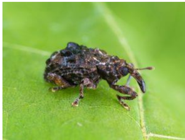
Adulte du charançon de la prune

Les adultes hibernent principalement dans la litière des boisés et des forêts d'arbres feuillus qui avoisinent les vergers, ou sous des amas de branches ou des bâtiments. La plupart de ceux qui restent dans le verger pendant l'hiver ne survivent pas, sauf si le temps reste doux et/ou que la neige est abondante tout l'hiver.