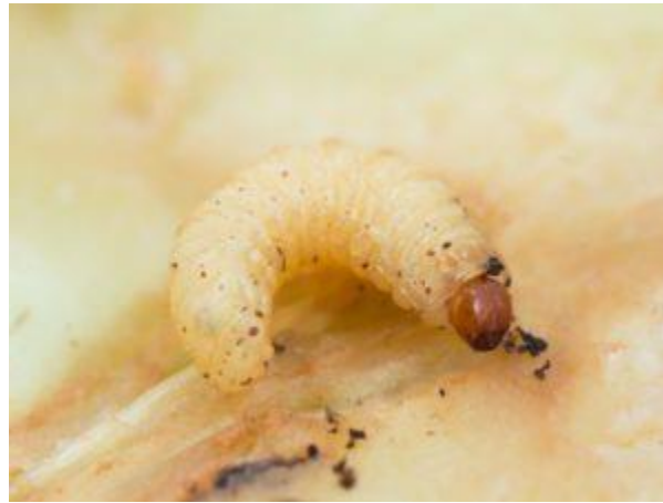
Larve du charançon de la prune