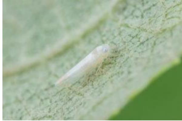
Adulte de cicadelle blanche du pommier