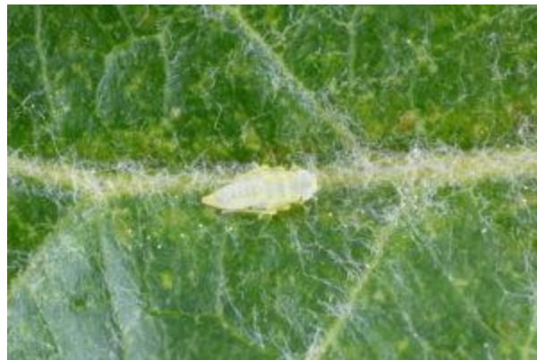
Larve de cicadelle blanche du pommier

La cicadelle de la pomme de terre ( Empoasca fabae ) peut aussi être présente dans les vergers. Elle se distingue de la cicadelle blanche par sa couleur plutôt verdâtre, par ses déplacements latéraux et par l'absence de stades larvaires avant le mois de juillet.