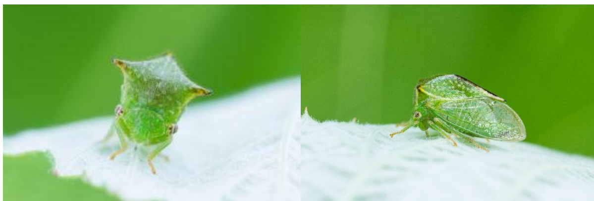
Adulte de cérèse buffle de face (gauche) et de profil (droite) (source : Joseph Moisan-De Serres, MAPAQ).

La cérèse buffle ( Stictocephala bisonia ) est un ravageur mineur en PFI. Cet insecte suceur vert pâle, de moins de 1 cm, porte sur le dos une protubérance pyramidale caractéristique qui lui donne l'apparence d'un buffle miniature. Au début du mois d'août, les femelles adultes délaissent les plantes herbacées pour pondre leurs œufs dans l'écorce des jeunes pommiers. Les œufs hibernants déposés dans le bois de l'été précédent éclosent durant la première moitié de juin. Les stades immatures ne vivent pas sur le pommier, ils se déplacent sur les plantes de la famille des légumineuses (luzerne, trèfle, vesce jargeau, etc.) Par conséquent, ils sont favorisés par la présence de ces mauvaises herbes dans le verger nouvellement planté. Il n'y a qu'une génération par année.