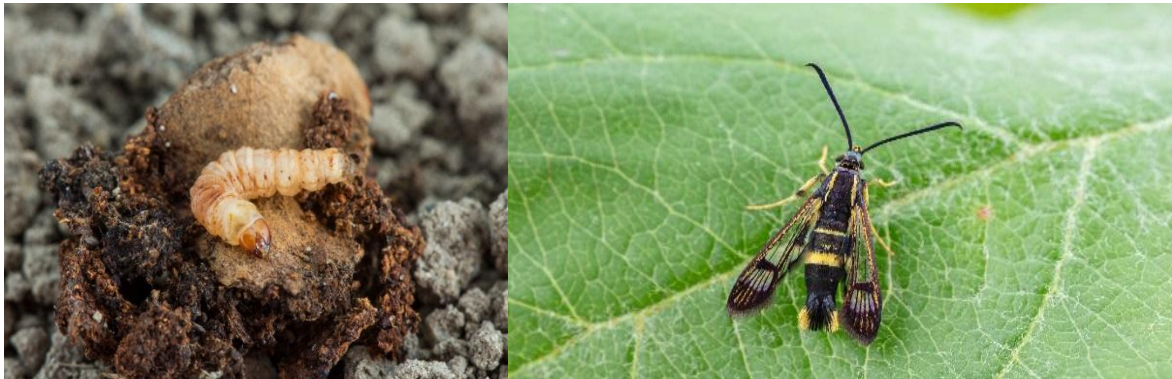
Larve (gauche) et adulte (droite) de sésie du cornouiller.

Les jeunes chenilles se nourrissent peu avant d'entrer en hibernation. L'activité reprend au printemps suivant, et la majorité des chenilles complètent leur développement à la fin du mois de juin. Une partie de la population reste cependant sous forme larvaire une année additionnelle. Il y a une génération par année.