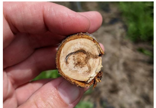
Dommmages de scolyte.