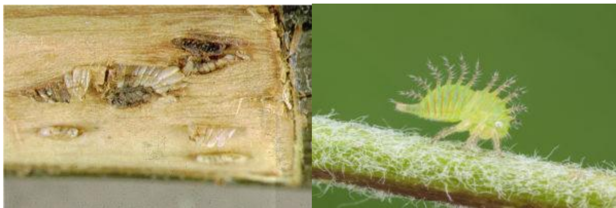
Œufs (gauche) et larve (droite) de cérèse buffle.