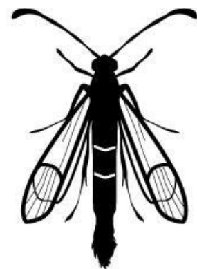
Sésie du cornouiller