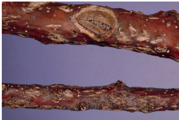
Domage de ponte du cérèse buffle.

Les femelles adultes pratiquent des incisions sur l'écorce des jeunes pommiers pour y déposer leurs œufs. Ces incisions font lever l'écorce et la rendent très rugueuse. Lorsqu'elles sont nombreuses, ces blessures entravent la circulation de la sève et affaiblissent les jeunes pousses, qui peuvent en mourir.