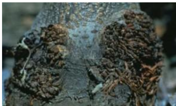
Dommmages de sésie du cornouiller.

Les galeries de la sésie constituent une porte d'entrée pour les maladies, comme les chancre. De plus, dans le cas d'infestations prolongées, l'arbre perd de sa vigueur et son rendement diminue. Les impacts peuvent être d'autant plus importants pendant les cinq premières années de vie d'une plantation. Le contrôle de ce ravageur est nécessaire afin de ne pas nuire au plein potentiel de développement des arbres. Les pommiers standards et semi-nains établis peuvent aussi être attaqués par ce ravageur, sans toutefois en être affectés de façon importante.