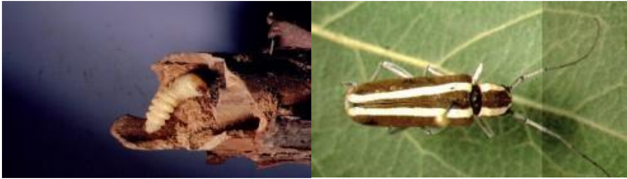
Larve (gauche) et adulte (droite) saperde du pommier (source : AAC et MAPAQ).