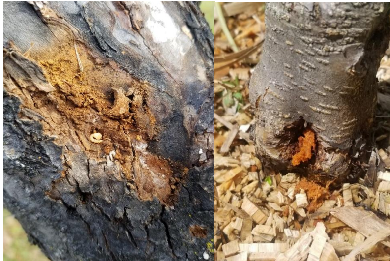
Dommmages causés par la saperde du pommier.

Au début, le développement larvaire s'effectue essentiellement au niveau de l'écorce et du cambium. Des zones noircies, affaissées, humides et pourries vont être observées. Par la suite, à l'année 2 et 3, la larve va s'enfoncer dans le bois du pommier pour former une galerie. On pourra observer des déjections rougeâtres au sol et/ou à l'entrée de la galerie.