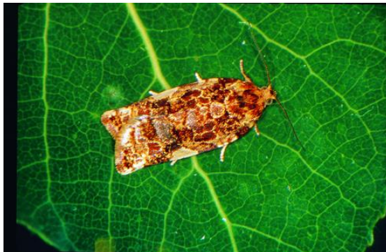
Adulte de la tordeuse du pommier.