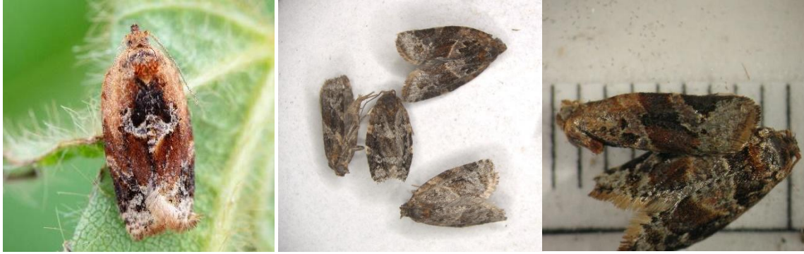
Adultes de tordeuse à bandes rouges (source : Laboratoire d'expertise et de diagnostic en phytoprotection, MAPAQ et IRDA).

Au stade bouton rose, les femelles déposent leurs œufs, en masses aplaties d'environ 50, en dessous des branches ou directement sur les troncs. Ces œufs (1 mm) sont jaune pâle et éclosent habituellement au stade calice. Les larves sont des chenilles vert pâle ayant la tête jaune ou brun clair, atteignant jusqu'à 17 mm de longueur chez les derniers stades. On peut donc facilement les distinguer des larves de tordeuses à bandes obliques (TBO) dont la tête est brun-noir et qui peuvent faire jusqu'à 25 mm de longueur. Outre par leur apparence, les deux espèces peuvent également être différenciées par le fait qu'on ne retrouve généralement pas les mêmes stades aux mêmes périodes. Les premières larves de tordeuses à bandes rouges ne sont pas présentes avant la fin mai et seuls de très jeunes stades sont observés à cette période.