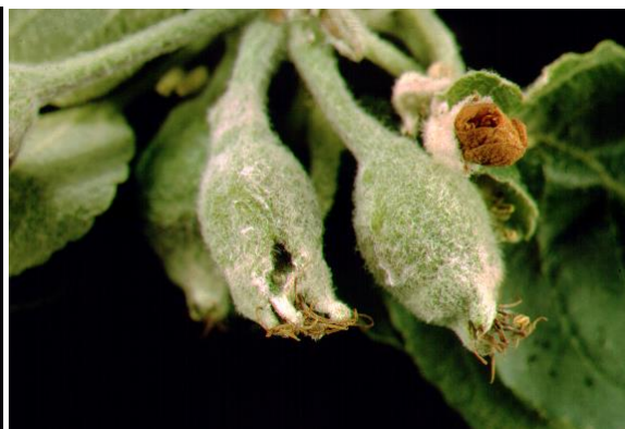
Dommmages sur feuilles et sur fruits de la tordeuse pâle du pommier (source : Leo-Guy Simard, AAC).