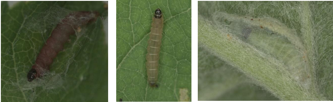
Larves de la fausse-teigne des bourgeons (source : Francine Pelletier, IRDA).

semblable à celui du pique-bouton et elle se nourrit de façon similaire sur le feuillage au printemps. Comme le pique-bouton, la larve est brunâtre mais un peu plus petite (6 mm en fin de développement) et un peu plus pâle (légèrement violacée/rosée). Le dernier stade peut même ressembler à une TBO car elle prend une coloration verte. Son hôte préféré est le pommier mais elle n'attaque pas les fruits.