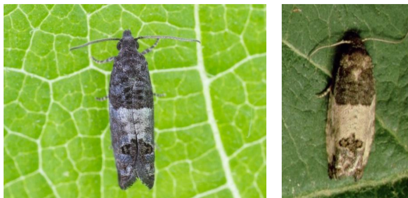
Adulte du pique-bouton du pommier forme grise (gauche) et forme claire (droite).

Les chrysalides sont formées à l'intérieur des abris ayant servis de site d'alimentation dans le feuillage. Le vol des adultes débute à la mi-juin. Ces derniers sont de petits papillons grisâtres (6-8 mm) aux ailes antérieures ornées d'une large bande blanche qui couvre la partie centrale des ailes. Une forme claire et une forme plus foncée peuvent être observées. La présence d'une marque noire distinctive sur le dos dans la partie distale de l'aile aide à reconnaître l'espèce parmi les différents patrons de coloration.