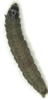
Adulte et larve du pique-bouton bigarré.

L'espèce complète une génération par année et passe l'hiver au 3 e stade larvaire. Les principaux dommages se font au printemps par l'alimentation des larves sur les bourgeons floraux. Il est toutefois peu commun que les populations soient suffisamment importantes pour que cela occasionne des dommages économiques. Le vol des papillons débute à la fin mai, soit un peu avant celui de la TBO. Les œufs sont pondus de façon isolée, généralement à la face inférieure des feuilles. Les larves de la nouvelle génération se nourrissent principalement à la face inférieure des feuilles, à l'abri, sous la soie qu'elles produisent.