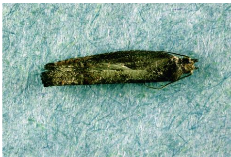
Adulte de la tordeuse pâle du pommier.

La tordeuse pâle du pommier ( Pseudexentera mali ), aussi appelée enrouleuse du pommier, est un ravageur mineur en PFI. Les larves de cette tordeuse sont des chenilles blanc crème mesurant 10 mm en fin de développement. Chez les jeunes larves, la tête est noire alors que chez les larves plus âgées, la tête est brun clair. L'espèce est univoltine et passe l'hiver dans le sol sous forme de chrysalide. Les adultes émergent au tout début de la saison, dès que la température atteint 10 °C. Ce sont des papillons gris terne de forme allongée mesurant 6-8 mm. Les œufs rosés sont pondus individuellement sur l'écorce des lambourdes et les brindilles. La ponte est généralement pratiquement complétée avant même le débourrement avancé.