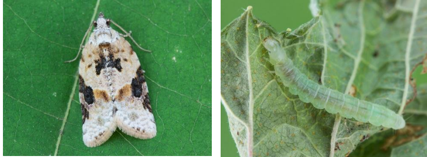
Adulte et larve de tordeuse à bandes grises.

La tordeuse à bandes grises ( Argyrotaenia mariana ) est un ravageur mineur en PFI. Elle appartient au même genre que la tordeuse à bandes rouges (TBR). Comme cette dernière, elle hiberne au stade de chrysalide mais ne produit qu'une seule génération par année. Les larves ressemblent à celles de la TBR mais sont légèrement plus grosses (17-23 mm en fin de développement). Elles ont le corps vert clair et la tête jaune verdâtre. Le papillon (8-10 mm) est principalement blanc ou gris pâle avec différentes marques brun-noir.