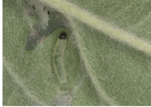
Larves de la tordeuse pâle du pommier à différents stades de développement (source : Leo-Guy Simard, AAC et Francine Pelletier, IRDA).

Les jeunes chenilles font leur apparition autour du stade bouton rose. Elles se nourrissent bien dissimulées dans le feuillage des bourgeons floraux et des pousses terminales. Elles poursuivent leur activité d'alimentation jusqu'à ce qu'elles aient complété leur développement larvaire, environ deux à trois semaines après la floraison. C'est donc vers la mi-juin qu'elles se déplacent au sol où elles construisent un cocon sous la surface du sol, à 2,5 cm de profondeur. Elles se transforment en chrysalides à la fin de la saison et passent l'hiver sous cette forme. À noter que la tordeuse pâle du pommier se nourrit exclusivement du pommier; à ne pas confondre avec la tordeuse du pommier (décrite ci-dessous), qui peut se développer sur plusieurs espèces d'arbres.