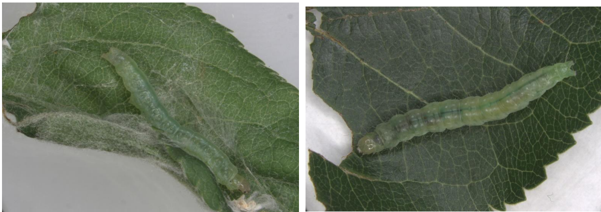
Larves de l'enrouleuse trilignée, Pandemis limitata (gauche) et de Pandemis lamprosana (centre).

Les larves Pandemis sp hivernent dans des cocons de soie sur le pommier dissimulés sous l'écorce. Ce sont des chenilles au corps vert et à la tête brun clair. Il est difficile de différencier les larves de l'espèce P. limitata de celles de P. lamprosana . On peut toutefois facilement les distinguer des larves de TBO qui ont la tête brune ou noire. Au printemps, les larves Pandemis sp. peuvent se nourrir des bourgeons à fruit, puis éventuellement des fleurs, des feuilles et des jeunes fruits. Elles forment leur chrysalide à l'intérieur d'une feuille enroulée. Le vol des adultes se produit environ à la même période que celui de la TBO, en juin et juillet.