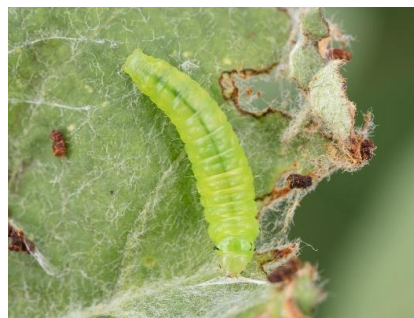
Adulte et larve de l'espèce Hedya chionosoma (source : Laboratoire d'expertise et de diagnostic en phytoprotection, MAPAQ).