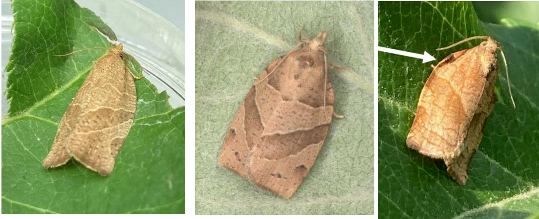
Adultes de l'enrouleuse trilignée, Pandemis limitata (gauche), de Pandemis lamprosana (centre) et de tordeuse à bandes obliques (droite). Des individus plus foncés de papillons Pandemis sp peuvent occasionnellement être rencontrés. Sur la photo de droite, la flèche montre le « costal fold » présent chez le mâle de TBO.

mâles de TBO ont également un repli en bordure de l'aile (« costal fold ») qui n'est pas présent chez les papillons Pandemis sp.