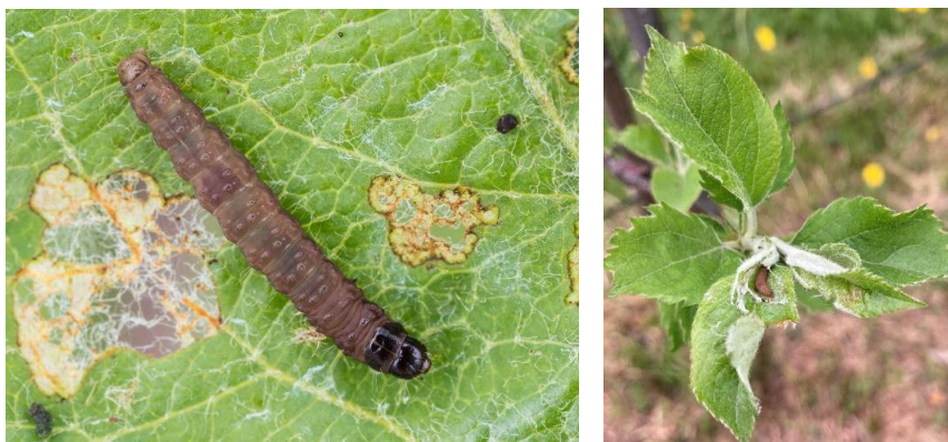
Larve du pique-bouton du pommier

Les chrysalides sont formées à l'intérieur des abris ayant servis de site d'alimentation dans le feuillage. Le vol des adultes débute à la mi-juin. Ces derniers sont de petits papillons grisâtres (6-8 mm) aux ailes antérieures ornées d'une large bande blanche qui couvre la partie centrale des ailes. Une forme claire et une forme plus foncée peuvent être observées. La présence d'une marque noire distinctive sur le dos dans la partie distale de l'aile aide à reconnaître l'espèce parmi les différents patrons de coloration.