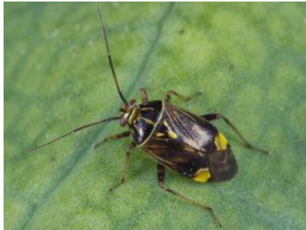
Adulte de punaise terne (source : Joseph Moisan-De Serres, MAPAQ).

La punaise terne ( Lygus lineolaris ) est un ravageur primaire en PFI. C'est un insecte brun, de 6 mm de longueur, au vol relativement rapide et facile à observer. Dès le débourrement, elle se trouve sur les jeunes bourgeons, dont elle extrait la sève. Elle est particulièrement active par temps chaud et calme.