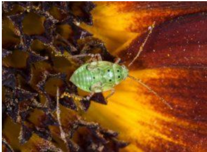
Larve de punaise terne (source : Joseph Moisan-De Serres, MAPAQ).

La larve, de couleur vert jaunâtre, a cinq points noirs sur le dos à partir du troisième stade larvaire. Les larves et les adultes des deux générations subséquentes ne se nourrissent pas sur les pommiers.