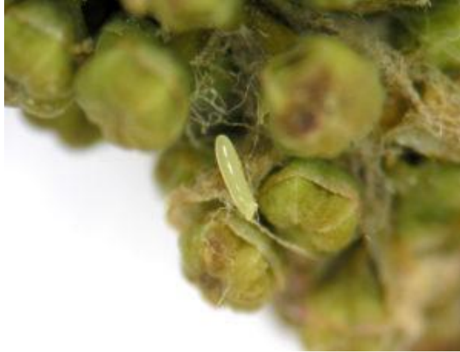
Œuf de punaise terne.

La larve, de couleur vert jaunâtre, a cinq points noirs sur le dos à partir du troisième stade larvaire. Les larves et les adultes des deux générations subséquentes ne se nourrissent pas sur les pommiers.