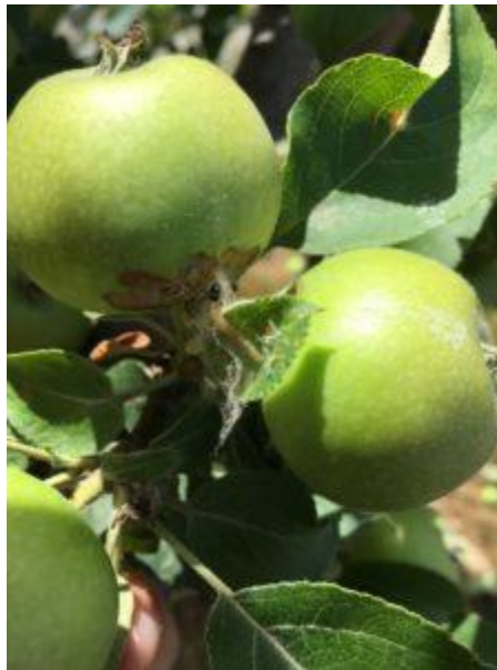
Larve de tordeuse à bandes obliques abritée entre une feuille et une pomme.

La taille de la masse d'œufs diminue à chaque ponte. Fraîchement pondue, la masse est de couleur vert pâle. À l'occasion elle peut devenir jaune, jusqu'au moment où il est possible d'apercevoir un petit point noir dans chaque œuf. Ce point noir est la tête de la future larve à naître. L'éclosion survient généralement de 7 à 15 jours après la ponte. Le corps de la jeune chenille est vert pâle et mesure 2 mm de long. Sa tête noire ou brune la différencie de la tordeuse à bandes rouges, qui a la tête verte comme le reste de son corps. Les dernières feuilles de la pousse annuelle encore enroulées sont un abri idéal pour les premiers stades, qui se nourrissent de jeunes feuilles ou de pommes. Lorsqu'elles sont nombreuses, il est possible de les observer aussi sous les feuilles, attachées par des fils qu'elles tissent à la nervure centrale. Lorsqu'elle atteint des stades plus avancés, la chenille laisse son premier abri pour en trouver un deuxième et continue à se développer. Grâce à des fils de soie, elle enroule les feuilles autour d'elle pour fabriquer cet abri. Elle peut aussi s'abriter entre des pommes et s'en nourrir.