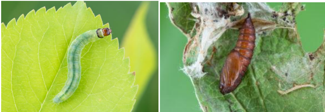
Larve et chrysalide de tordeuse à bandes obliques.