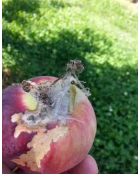
Domage de tordeuse à bandes obliques à la récolte.