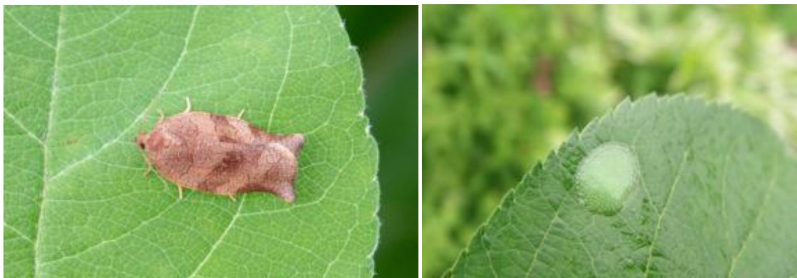
Adulte et masse d'œufs de tordeuse à bandes obliques.

L'adulte (14 mm) est un papillon de nuit brun pâle avec trois bandes obliques foncées sur les ailes antérieures. Il émerge et s'accouple au mois de juin. La femelle pond ses œufs par masse de 50 à 600 œufs sur le dessus des feuilles. La ponte commence quelques jours après l'accouplement et se termine vers la fin juillet. Sur une période de sept à huit jours, elle peut pondre plusieurs masses totalisant jusqu'à 900 œufs.