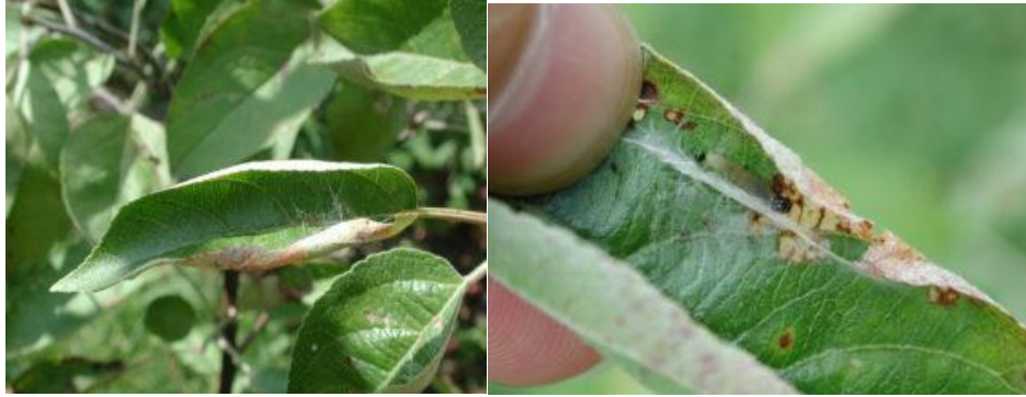
Larve de tordeuse à bandes obliques enroulée dans une feuille (la feuille a été déroulée afin de rendre la larve visible)(source : IRDA).