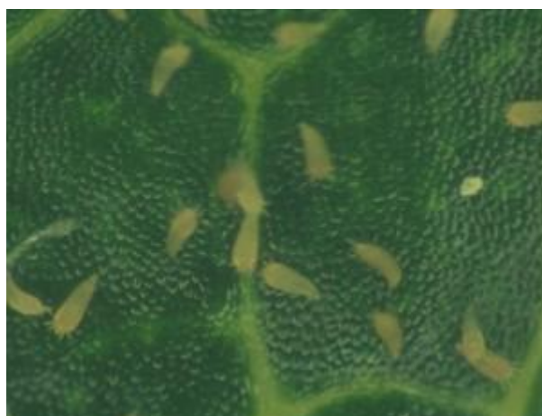
Ériophyides du pommier.

L'ériophyide du pommier ( Aculus schlechtendali ) est un ravageur mineur en PFI. Il est allongé et de couleur brun-jaune. Cet acarien est cinq fois plus petit que les tétranyques : l'adulte mesure à peine 0,07 mm. Il n'est pas visible à l'œil nu et les jeunes stades sont difficiles à voir, même avec une loupe.