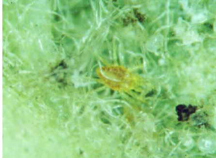
Acarien stigmatéide.