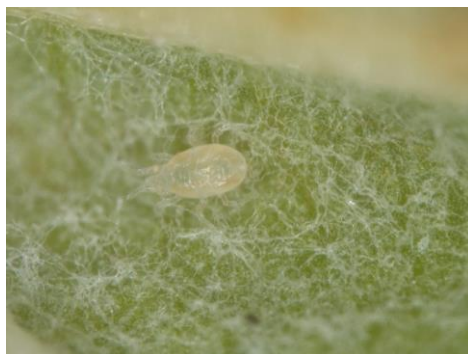
Acarien phytoséiide.

Les phytoséiides regroupent les plus voraces des acariens prédateurs. Ils complètent plusieurs générations par année sous les conditions climatiques du Québec. Plusieurs espèces peuvent être rencontrées dans les vergers mais les deux plus communes sont Neoseiulus (= Amblyseius ) fallacis et Typhlodromus caudiglans .