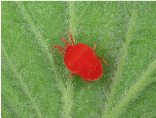
Acarien du genre Allothrombium spp au stade adulte.

Acariens du genre Allothrombium spp au stade larvaire avec son hôte (puceron).