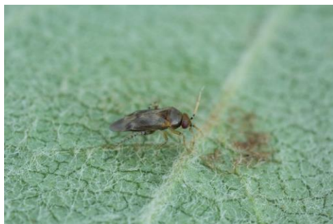
Punaise de la molène adulte.

rouges. La larve et l'adulte sont également prédateurs de pucerons. Malheureusement, durant une courte période, les jeunes larves peuvent également se nourrir de jeunes fruits, et leur comportement est difficile à prévoir.