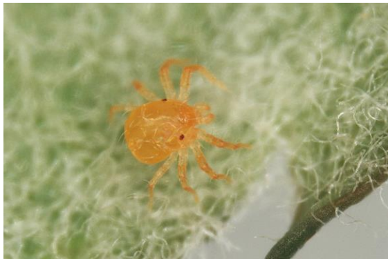
Anystis baccarum.

Anystis baccarum est un petit acarien rouge visible à l'œil nu (1,0-1,5 mm) qui se déplace rapidement sur le feuillage. Il a l'aspect d'un petit crabe. Son corps et ses pattes sont parsemés de soies. C'est un prédateur commun en verger et en vignoble. L'espèce se nourrit d'acariens, de cicadelles et de pucerons.