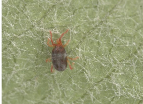
Acarien du genre Balaustium sp. (Source: IRDA).

insectes au corps mou ainsi que de pollen. Ils sont souvent observés se déplaçant rapidement sur le feuillage en début et en fin de saison.